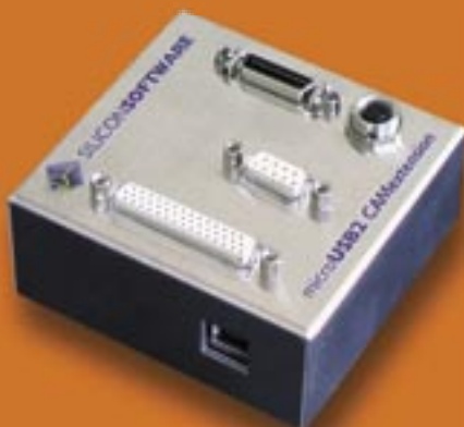
Abb. 2: mobiler Framegrabber microUSB2 CAMextension