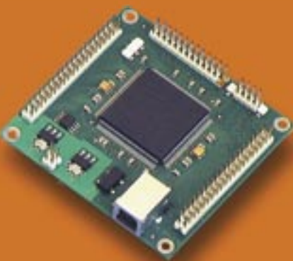
Abb. 1: Integrationsplatine microUSB2

Generell zeichnen sich bei diesen externen Interfaces für externe Peripherie, sei es Firewire, USB2 oder auch Gigabit Ethernet, die gleichen Probleme ab. Bei höheren Transferraten steigt die CPU-