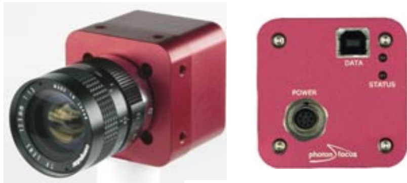
Abb. 3: Photonfocus Kamera mit USB2-Interface

Neben der Übertragungsgeschwindigkeit ist die momentane CPU-Auslastung wichtiges Merkmal, ob weitere Bildverarbeitung und -auswertung möglich sind. Durch den Verzicht auf das dreischichtige Treibermodell zugunsten einer einschichtigen Lösung, wurde ein Großteil des Treiber-Overheads umgangen. Zwischen dem Betriebssystem und