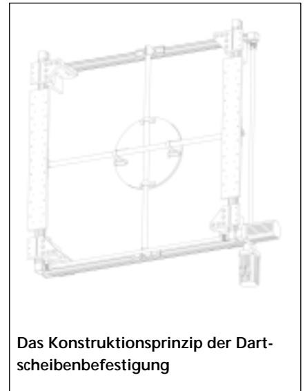
Das Konstruktionsprinzip der Dartscheibenbefestigung

Zu diesem Zeitpunkt waren bereits 50 % der Gesamtprojektlaufzeit vorüber. Nachdem für den abschließenden Integrations- und Systemtest drei Wochen im